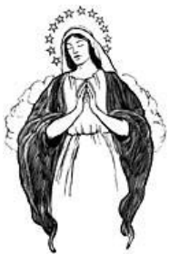
Illustration 2001 K. Sullivan.